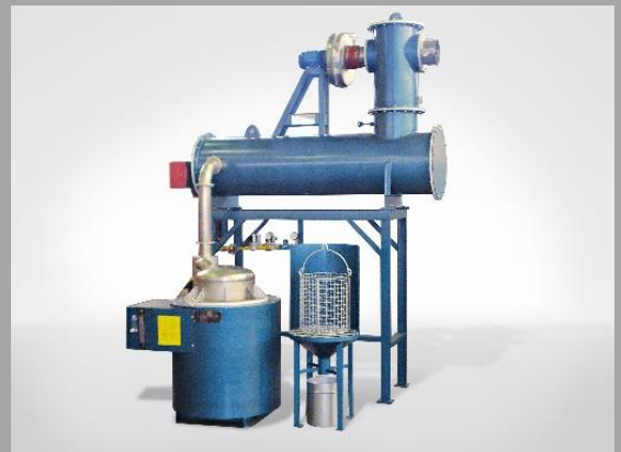
Afterburner: AB-20.1 Forno: PCS-16.16